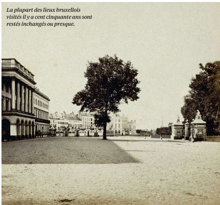
La plupart des lieux bruxellois visités il y a cent cinquante ans sont restés inchangés ou presque.

Ainsi, si toutefois il vous arrivait par un beau soir estival, au détour d'une allée du parc, de humer l'air du couchant, il n'y aurait rien de surprenant à ce que